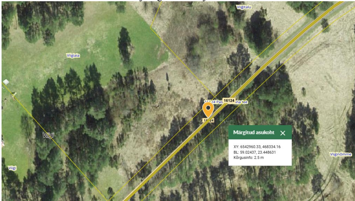
Joonis 1. Ristumiskoha asukoht tähistatud oranži tingmärgiga.